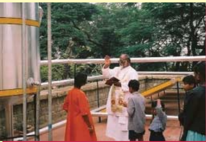
Einsegnung der Sonnenkollektoranlage

Als Beispiel für das moderne Denken der Schulleiterin möchten wir hier zeigen, dass die von uns finanzierte Sonnenkollektoranlage für die Gewinnung von Strom für die Wasserversorgung geschaffen wurde.